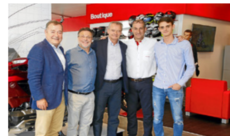
El presidente de Honda Motor Europe para España y Portugal, Marc Serruya (en el centro), estuvo presente en la inauguración del nuevo local de Blanmoto.

La inauguración oficial del nuevo local de Blanmoto fue el pasado 30 de mayo y contó con la presencia del presidente de Honda Iberia, Marc Serruya, y de José Peiró, PR & Social Media de Honda Motor Europe España, entre otros invitados.